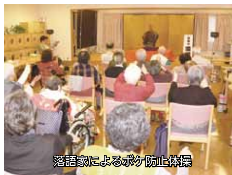
落語家によるボケ防止体操

全共連が主催する高齢者向け交通安全教室が4月11日、ケアセンターにおいて開催されました。