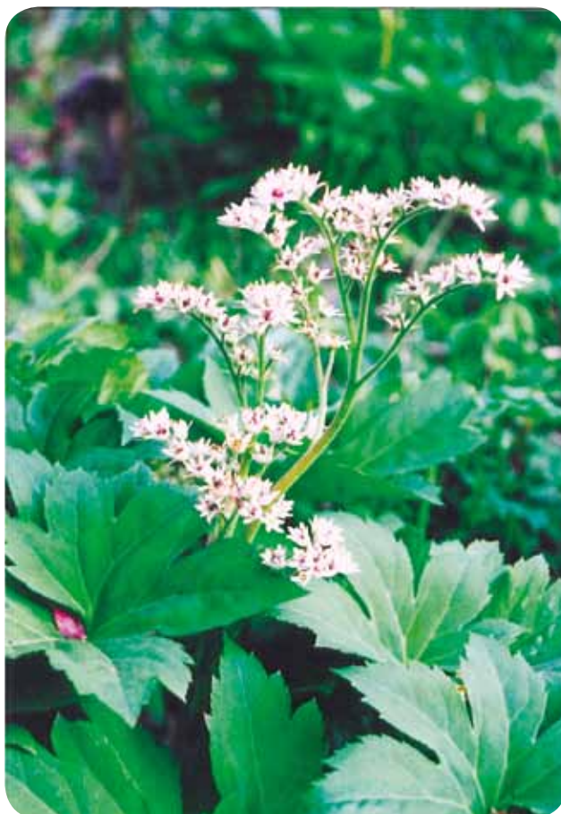
タンチヨウソウ (ユキノシタ科)

3月上旬、カタクリ塚にタンチヨウソウの赤い蕾が出てきました。5月になっても、白いがく片と花弁が重なり合っていて、咲いていません。和名丹頂草は、花を丹頂鶴の頭に、茎を首に、葉を羽根に見立てたのが由来です。岩場に生え、葉がヤツデに似ているため、別名イワヤツデともいわれます。原産地は朝鮮半島から中国東北部の、日陰の岩場に生える多年草です。長い花茎の頂上に白い5弁の花が密集し、花は上向きにつき、雄しべの花粉が赤く見えるのが特徴です。草丈30センチほどで、葉はヤツデのような形で深く切れ込んでいます。根の部分は横に伸び太い根茎が露出しています。株分けは根茎を切り分けます。根茎は硬いのでハサミを使い、芽を2つ程つけ、植え替えます。ずっと昔、駒井野の友達に分けてあげたタンチヨウソウが何倍にも殖えて戻ってきました。彼女の花に対する心遣いと人柄にふれ、とつても嬉しかったです。いつもながら、花はなるほどと感心させられる面白い名前がついています。イワヤツデよりタンチヨウソウの方が花全体の姿がわかり、命名した人のセンスです。すきな草には好きな名を、自分でつけて楽しんでいます。