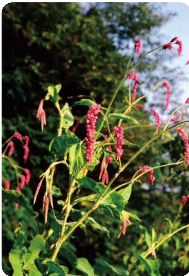
オオケタデ (タデ科)

焼け付くような暑さの中、東屋の前のオオケタデの紅紫色が風に揺れています。今年は格別な高温にあたるようですが、いつの間にか下の方の葉が枯れ、秋が近づいていることを感じます。