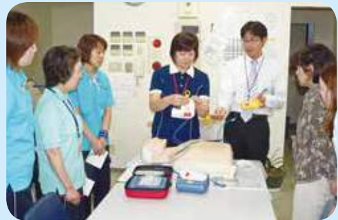
■AEDを導入し、講習会を開催 (平成21年7月21日撮影)

社会経済環境の変化に伴い、幅広い資産管理事業を展開しようと、平成14年にJA成田市資産管理組合として新たなスタートを切りました。