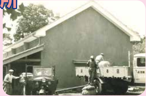
■酒々井町農業協同組合時代の米の作業風景 (昭和30年頃撮影)

昭和23年3月31日に酒々井町農業協同組合が設立。当時、管内では直売向けの地場野菜を中心に生産しており、現在も引き継がれています。