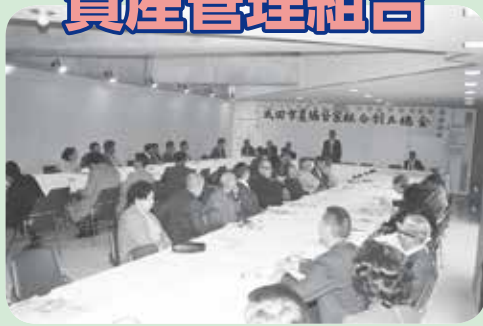
■成田市農協貸家組合設立総会を開催 (昭和48年10月8日撮影)

土地の高度利用の一環として組合員の方の貸家経営に役立てていただこうと成田市農協貸家組合が設立されました。