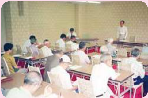
■毎年行われる総会での活発な意見交換の様子 (平成6年6月撮影)

地域の高齢福祉活動の貢献を目指し、県内JA初となる介護施設「ケアセンター美郷」を建設。パズルや輪投げなどのレクリエーションを行い、多くの利用者から好評です。