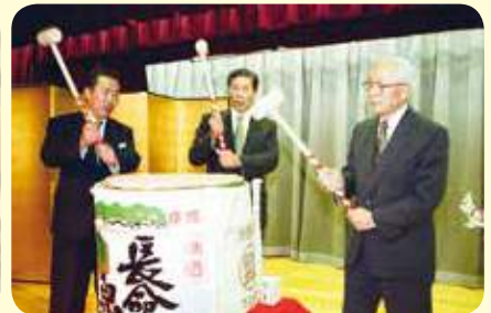
■新JA発足を祝った鏡開き

平成14年1月1日、JA成田市とJA千葉酒々井町が合併し、酒々井支所としてスタートを切りました。また、1月5日にはサンポップ大会議場において進発式を開催。新たなJA成田市として役職員が一丸となって組合員及び地域の皆様のために事業を展開していく事を誓いました。