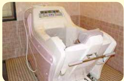
■JA全共連より贈呈された介護用の浴槽 (平成23年7月1日撮影)

資産管理組合では、土地の有効活用と資産の保安全管理などの資産管理事業を積極的に行うため、定期的に視察や研修等を実施しています。