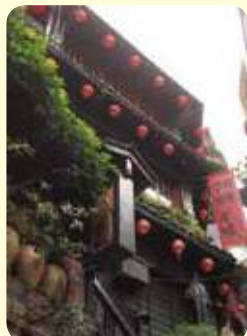
九份(カウフン)の街