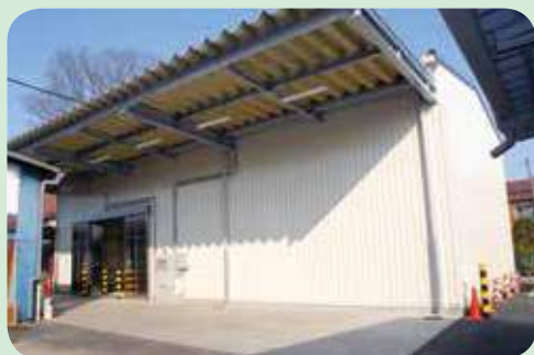
■酒々井地区に初の米穀低温倉庫が完成 (平成19年1月16日撮影)

平成14年1月1日、JA成田市とJA千葉酒々井町が合併し、酒々井支所としてスタートを切りました。また、1月5日にはサンポップ大会議場において進発式を開催。新たなJA成田市として役職員が一丸となって組合員及び地域の皆様のために事業を展開していく事を誓いました。