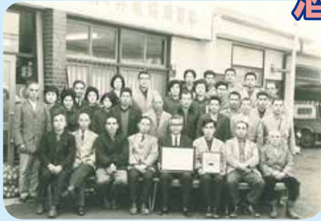
■酒々井町農業協同組合時代の当時の職員 (昭和40年頃撮影)

昭和23年3月31日に酒々井町農業協同組合が設立。当時、管内では直売向けの地場野菜を中心に生産しており、現在も引き継がれています。