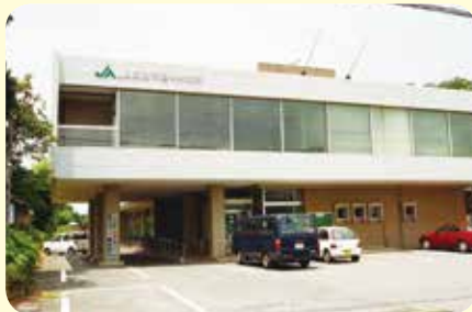
■合併当初の酒々井支所

昭和28年、敷地内に米穀倉庫が完成。当時は米俵を（1俵60kg）全職員が1つ1つ肩に担いで集荷や検査、出荷の作業を行っていました。