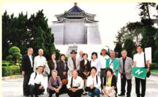
参加された皆様で記念撮影を行いました