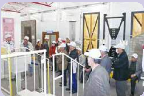
■視察にて住宅の最新の防犯機能を学ぶ組合員 (平成24年3月29日撮影)

施設利用者や地域の皆様の安心・安全のため、ケアセンター美郷にAED（自動体外式除細動機）を導入しました。