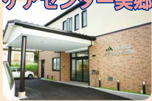
■建設当初のケアセンター美郷 (平成15年5月20日撮影)

地域の高齢福祉活動の貢献を目指し、県内JA初となる介護施設「ケアセンター美郷」を建設。パズルや輪投げなどのレクリエーションを行い、多くの利用者から好評です。