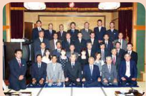
■貯金残高100億円を記念し祝賀会を開催 (平成19年10月10日撮影)

昭和28年より使用してきた米穀倉庫の老朽化に伴い、酒々井支所の敷地内に米穀低温倉庫を建設。米の低温保管による品質維持が可能となり、有利販売と効率的な運用に繋がっています。