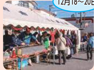
Aコープ店 (中央支所感謝祭同時開催)

各店舗とも多くの来場客が訪れ、用意した新鮮な産直野菜は昼過ぎに品薄となる盛況ぶり。また、「豚汁」「さつまいもスティック」の無料配布や抽選会が行われました。生産者及び職員と来場客が交流を深める姿も見られ、会場はとても賑っていました。