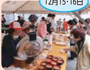
酒々井町農産物等直売所