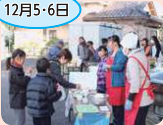
宝田農産物直売所