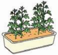
プランターでもよくできる。長型なら2株ずつ2カ所植え

収穫が始まったら図のように株・果実の下の方の葉は順次摘み取り、盛んに伸びだして来たら主枝の上の方を摘除して側枝に日を当て、よく伸びるようにしましょう。 半月に1回ぐらい、1株当たり大きじ1杯の化学肥料と油かすを株の周りに軽く耕し込みます。 害虫には割合やられやすく、ようやく盛んに伸び始めるとアブラムシ、フキノメイガ、カメムシなどが発生します。で、発生を見たら早めに適応薬剤で防除しますが、近年は葉を巻いて産卵し、活発に食害するフタトガリコヤガの害が目立つ地域が増えてきました。被害葉は見つけ次第、葉と一緒に切り取り、小さい幼虫は葉ごと手でつぶしてしまふことが大切です。その後適応薬剤を丁寧に散布して防ぎましょう。