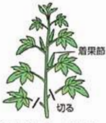
下葉が込み合ってきたら、箱栗節以下1〜2枚残して、その下の葉を取る