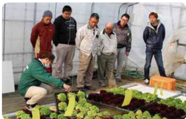
リーフレタスの試験栽培