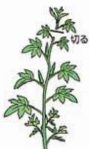
株が大きく育ったら、主枝を摘心し側枝を伸ばす