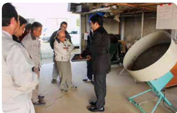
種子コーティングマシン

当JAでは昨年に引き続き新規就農者を対象とした講習会を開催しました。今回は成田市並木町にある「全農ちば営農技術センター」を会場としました。印旛農業事務所より水稻育苗の栽培管理のポイントや留意事項の説明を受けた後、全農ちばより育苗ハウスの有効活用したリーフレタスの「浮き楽栽培（*）」の紹介、水稻の省力・低コスト技術の例として、鉄コーティング種子を用いた直播栽培について説明を受けました。その後、リーフレタスの試験栽培を行っているハウスや鉄コーティング種子を作る「種子コーティングマシン」を見学しました。参加者は興味深く説明を聞き、今後の参考にしたいと語っていました。