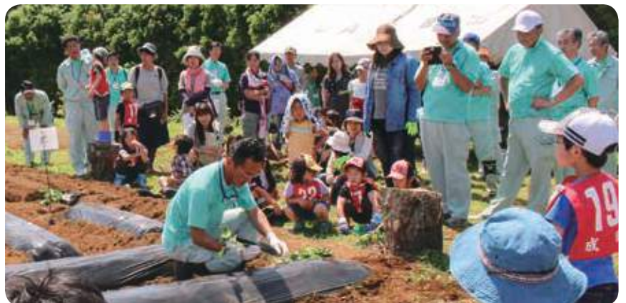
植え方を説明する職員