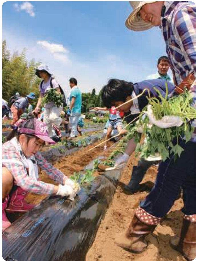
苗を植える参加者

参加者は「JAのイベントに参加するのは初めてだが、とても楽しかった。秋の収穫祭も楽しみ」と語っていました。