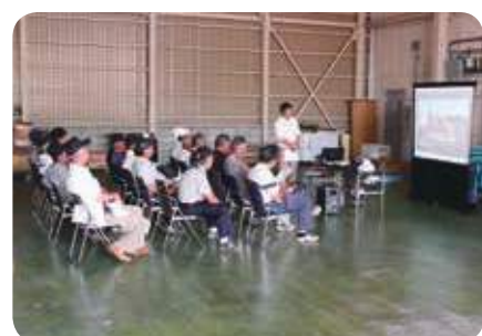
安全講習会の様子

開催され、参加者は「こういう機会に聞けるのはありがたい。気を付けて作業しようと思う」と話していました。また、両日も午前午後の2回にわたり、草刈機や自転車などの豪華景品を多数用意した大抽選会を開催し、盛り上がりを見せました。