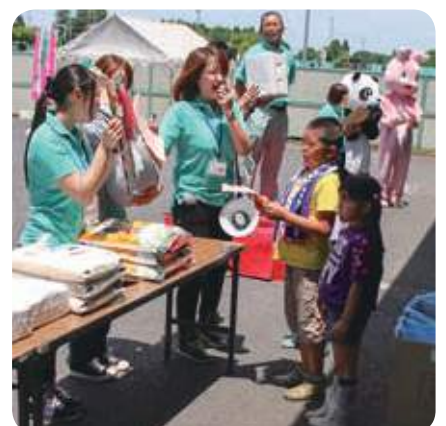
ビンゴゲームの様子