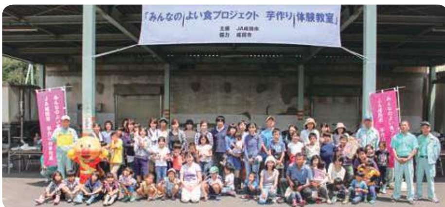
参加者全員で集合写真